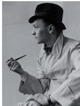
H.-D. Schwarz, Aufnahme 1940er Jahre, Privatbesitz

Mitte der 1980er Jahre gelang Helga Paris mit der Serie „Häuser und Gesichter“ in über 100 eindrücklichen Fotografien ein sensibles Porträt der Stadt Halle (Saale). Eine für 1986 geplante Ausstellung fiel den Bedenken der Kulturfunktionäre zum Opfer: Zu deutlich zeigten die Bilder den architektonischen Verfall und morbiden Charme der Saalestadt im Jahr ihrer 1025-Jahr-Feier.